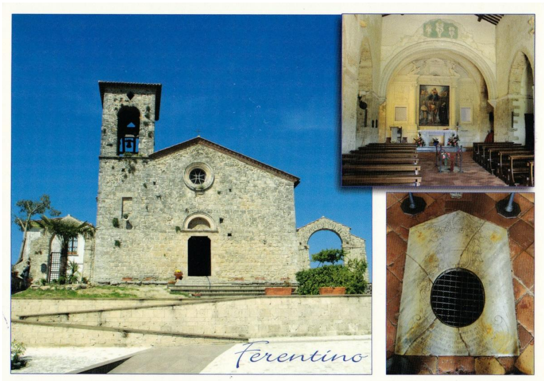
Ferentino, S. Antonio abate, facciata e interno della chiesa cartolina postale, collage