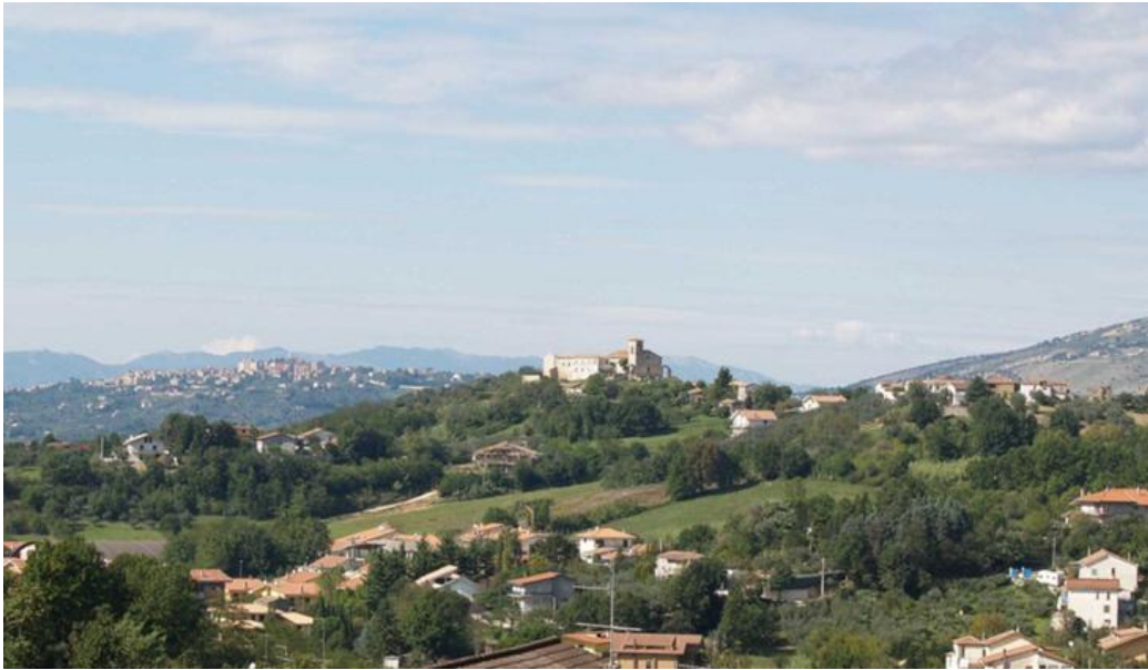
Ferentino, Chiesa e monastero di S. Antonio abate, panorama sullo sfondo la città di Anagni