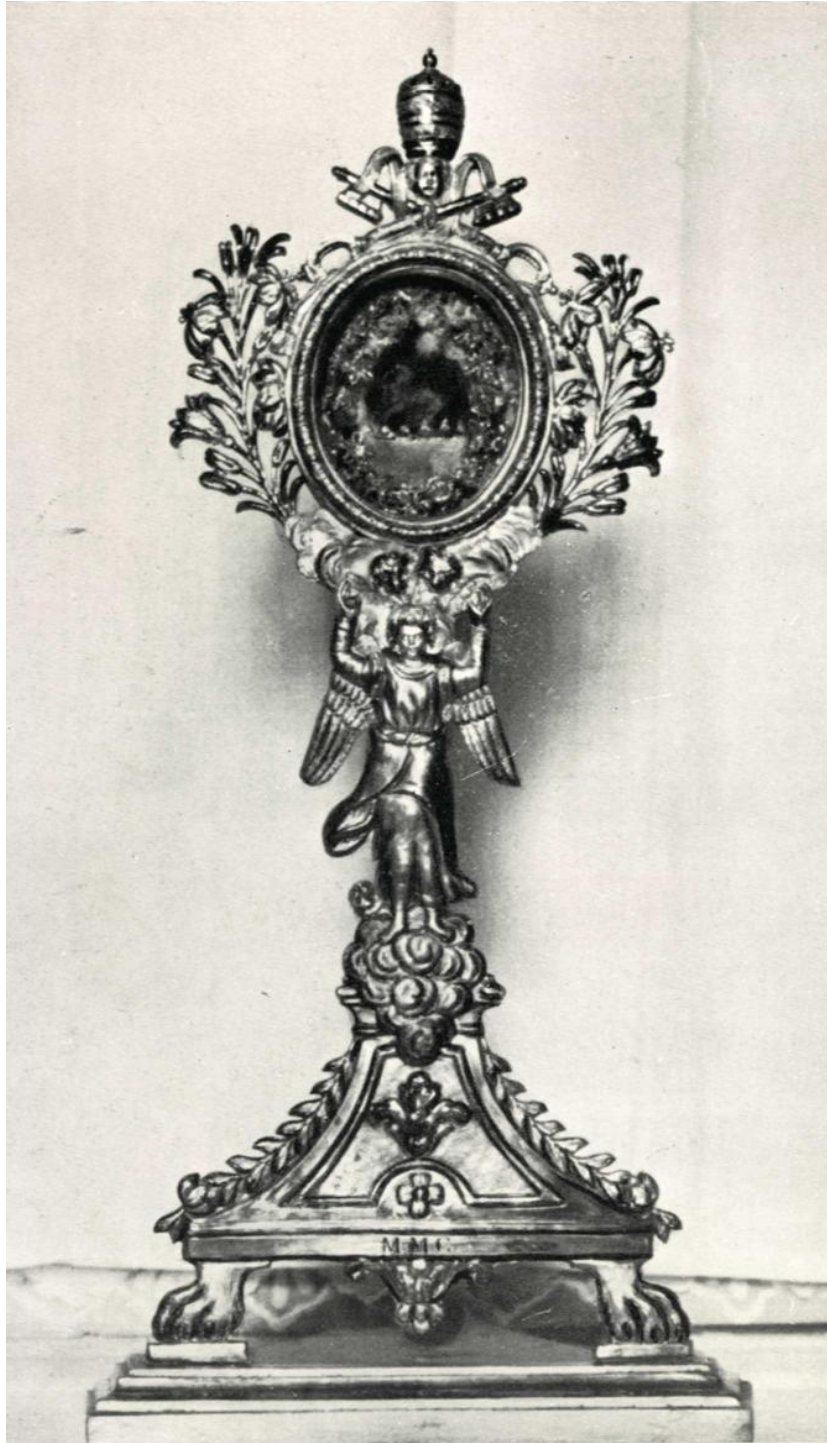
Ferentino, Reliquiario con il cuore incorrotto di S. Pietro Celestino Il reliquiario fu dono del card. Carlo Ludovisi (1683)