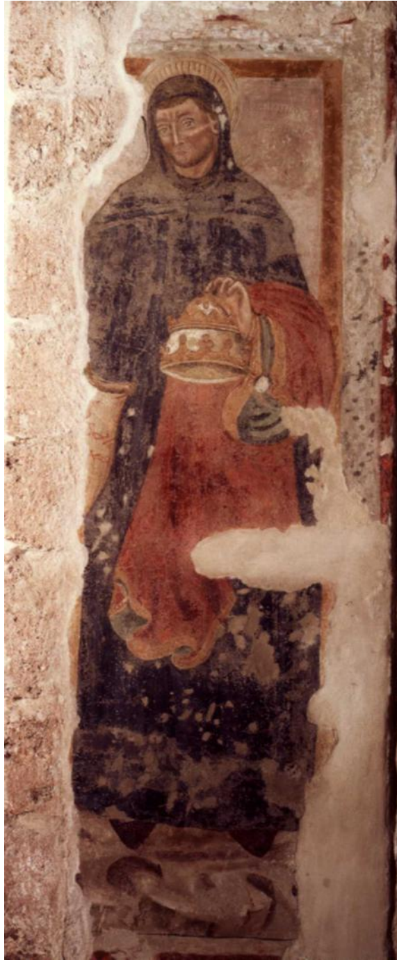
Ferentino, Chiesa di S. Antonio abate S. Pietro del Morrone-Celestino V, affresco, sec. XIV