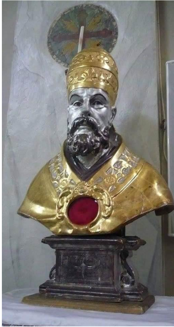
Ferentino, Busto reliquiario di S. Pietro Celestino (sec. XVIII)