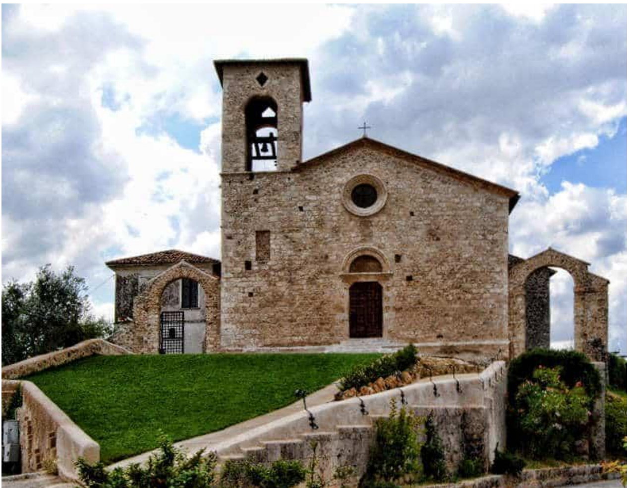
Ferentino, "Colle del Fico", chiesa di S. Antonio abate, XIII sec.

Celestino intorno al 1263 venne a Ferentino, la Città di Pietra fondata sulla pietra, e scelse S. Antonio abate, chiesa fondata sulla pietra: metafora di un legame profondo tra la pietra del Morrone e la pietra di Ferentino, metafora misteriosa e anticipatrice di quello che sarebbe divenuto Pietro: roccia viva su cui Cristo avrebbe fondato la sua Chiesa. A Ferentino Celestino, diventato dopo il 13 dicembre 1294 di nuovo Pietro, avendo abbandonato il soglio pontificio e deposto le insegne di un potere, che rischiava di tradire il vero significato del Cristianesimo e la vera finalità della Chiesa romana, tornò nel 1296 per essere accolto in un sepolcro di pietra, scavato nella pietra del Colle del Fico (quante similitudini con il discorso e la simbologia dei Vangeli!) nella Chiesa di Celestino, S. Antonio abate.