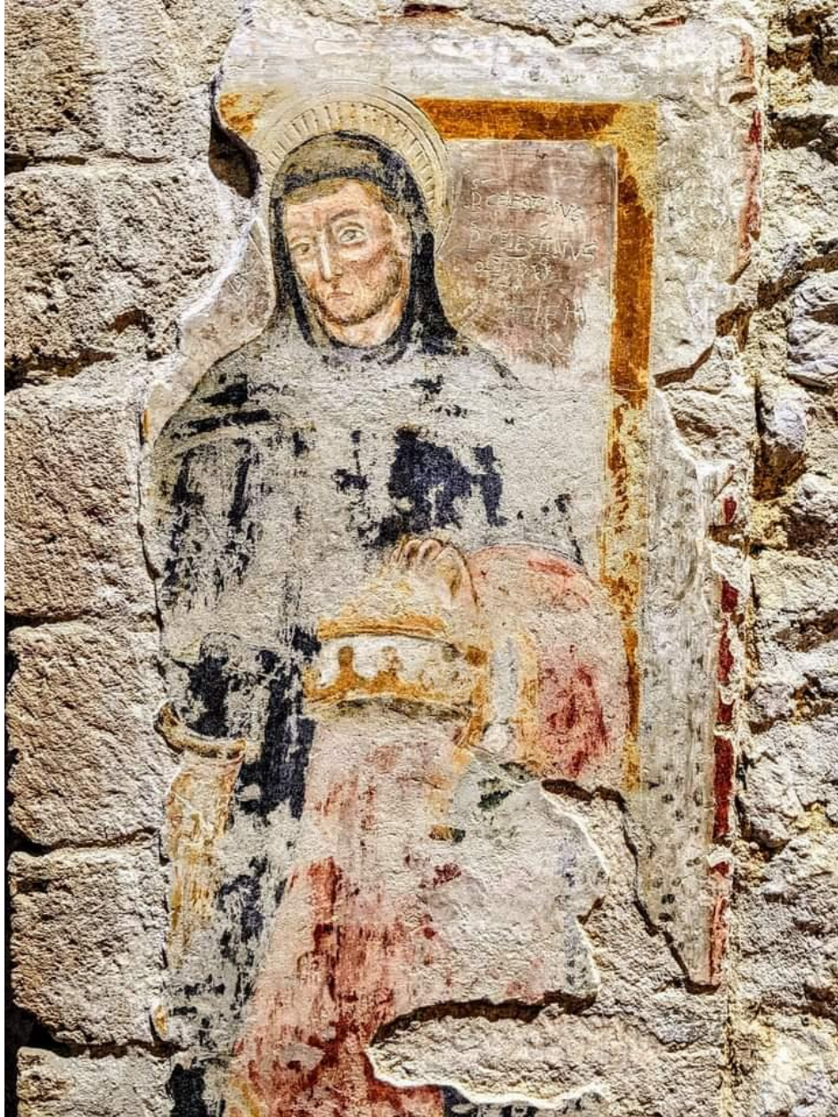
Ferentino, Chiesa di S. Antonio abate affresco raffigurante Celestino V, XIV sec., prima del restauro

Ma qui avvenne un miracolo: alla città di pietra Celestino donò il suo cuore di carne, simbolo dell'Amore, del Perdono, della Misericordia... La " miseri – cordia ": il cuore segno di pace e di perdono donato gratuitamente a tutti gli Uomini, " poveri " peccatori di fronte alla suprema maestà e purezza di Dio. Ed anche Ferentino da subito celebrò la festa del perdono non solo nel giorno di S. Giovanni Battista (28-29 agosto) ma anche in tutti i venerdì del mese di marzo e in tutte le feste dei Santi e della Vergine, celebrate a norma degli Statuti Medievali della Città, per molti secoli.