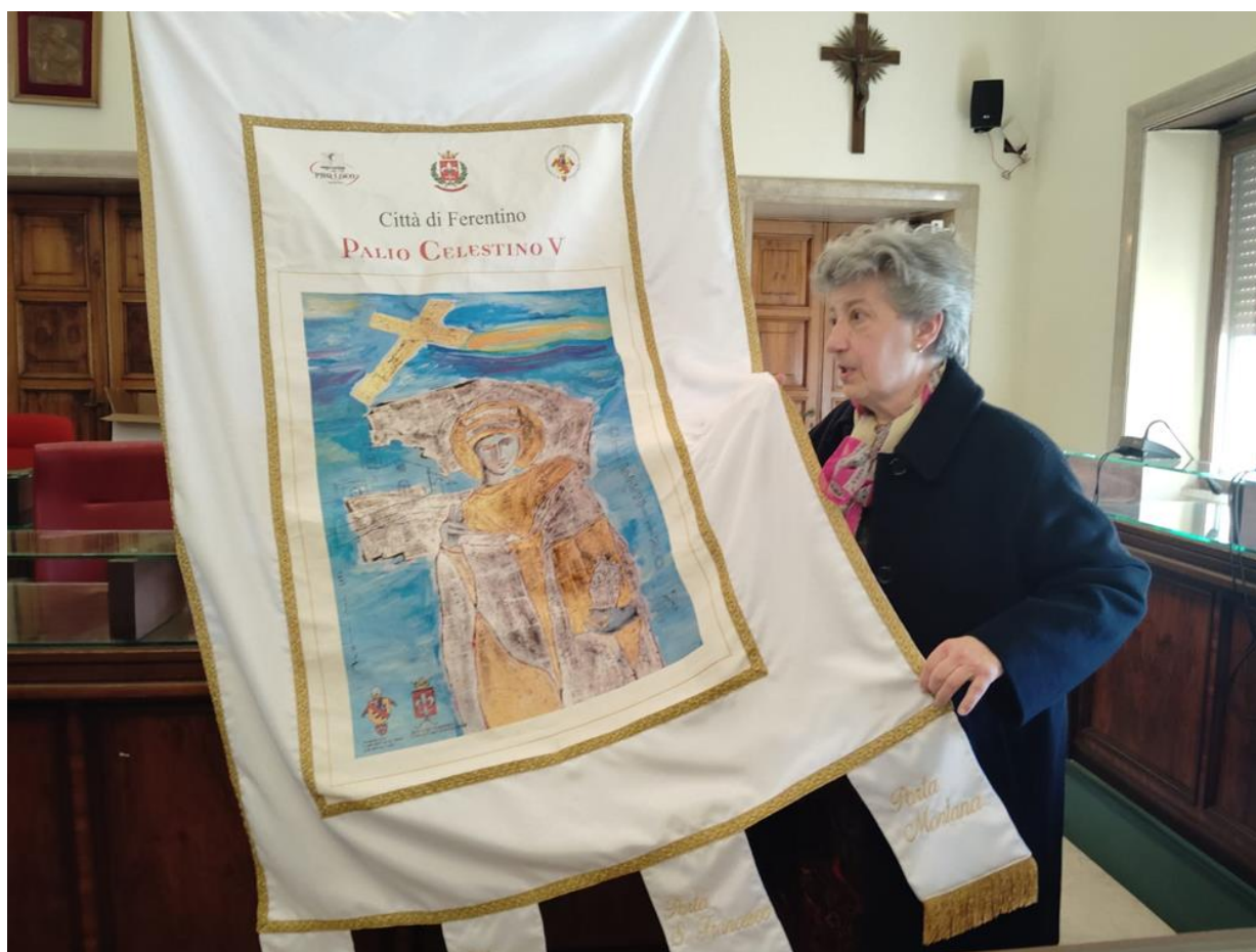
Ferentino, Sala Consiliare Comune di Ferentino 11 aprile 2025 ore 11.00 prima esposizione del Palio Celestino V