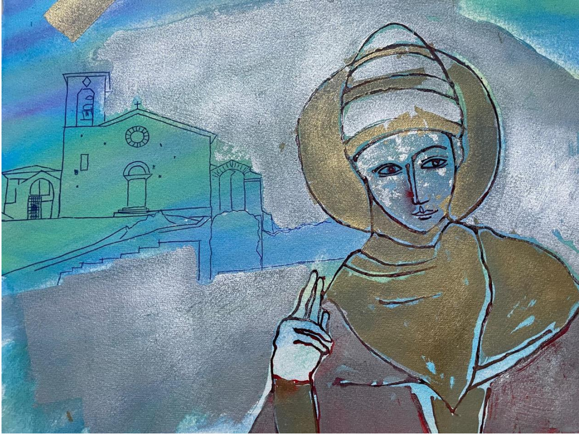
Enzo Arduini, studio per la realizzazione del Palio Celestino V, 2024, particolare