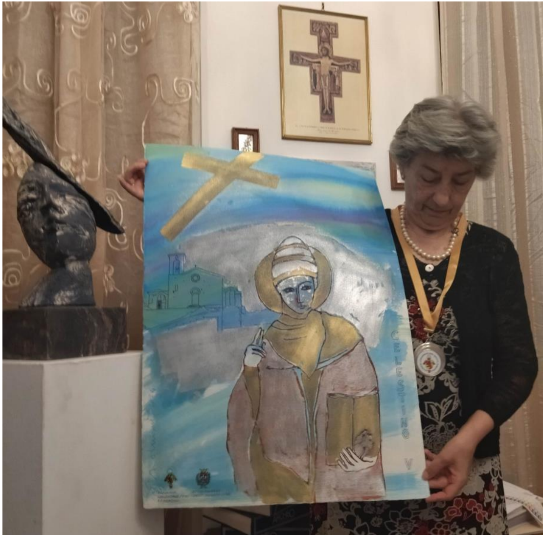
Ferentino, 1° settembre 2024 consegna a Biancamaria Valeri, presidente dell'Accademia Celestino V del Palio (Bravium) per S. Pietro Celestino - bozzetto di studio

Il bellissimo studio disegna su uno sfondo celestiale, simbolico riferimento al nome del compatrono, Celestino V, raffigura il S. Papa giovane, circondato d'oro e d'argento, semplice nella posa e nell'abbigliamento. Celestino stringe nella mano destra il libro d'oro che simboleggia il Vangelo, la Legge, la Cultura e nella mano emerge vivo e palpitante il suo cuore, dono prezioso alla città di Ferentino. Il cuore si sovrappone e sorregge il libro: è una testimonianza è una metafora che sintetizza tutta la vita di Pietro del Morrone, anche quando fu Papa. Egli fu caratterizzato dal silenzio e dall'amore, dalla donazione sulla Parola di Cristo e nella preghiera.