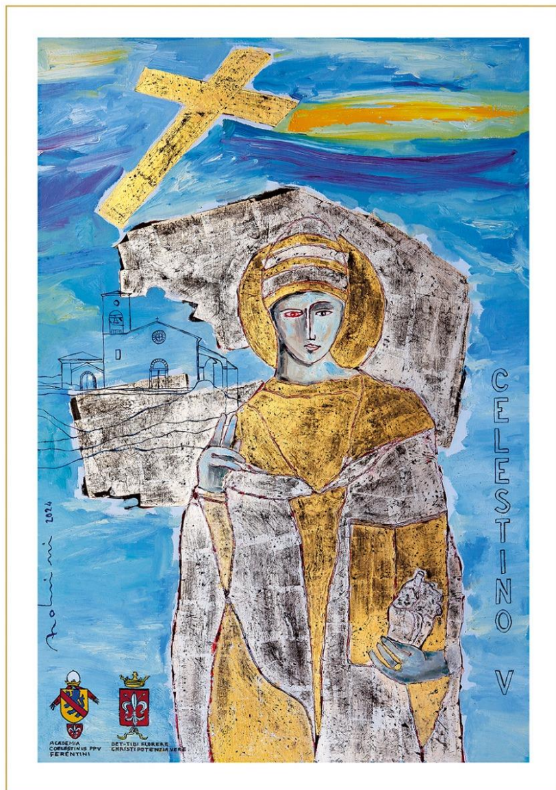
Palio Celestino V stampa fotografica opera di Fulvio Bernola