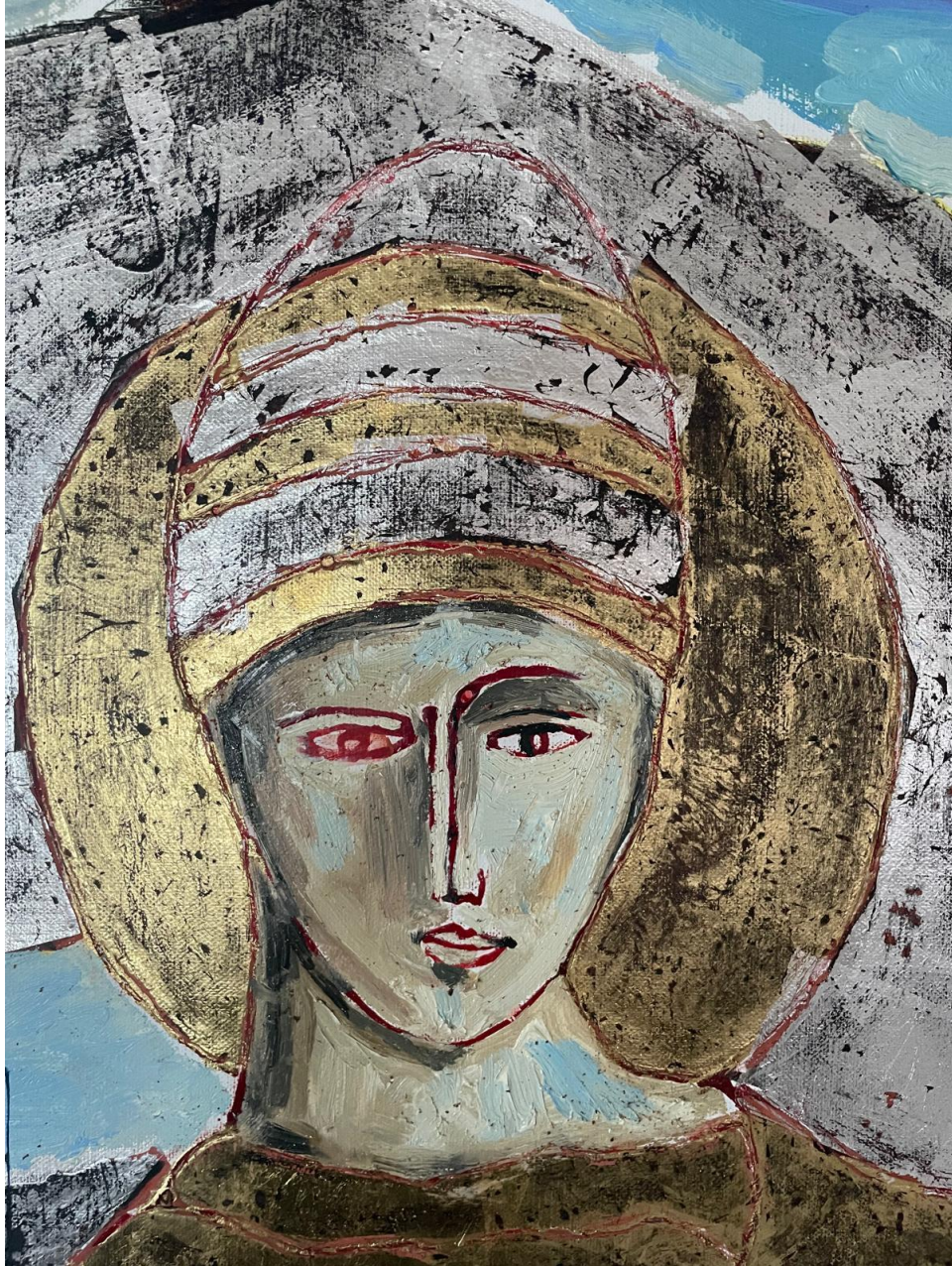
Enzo Arduini, Celestino V, 2025 particolare del volto