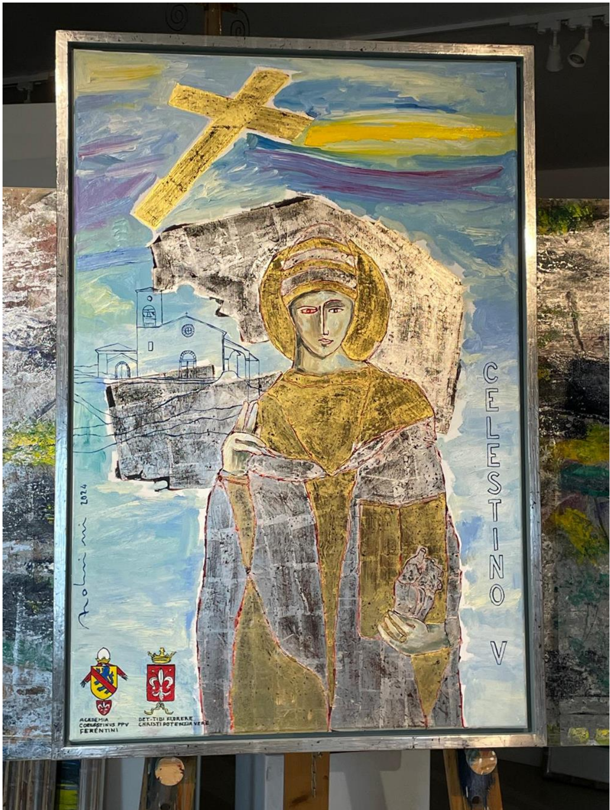
Enzo Arduini, Celestino V, 2025