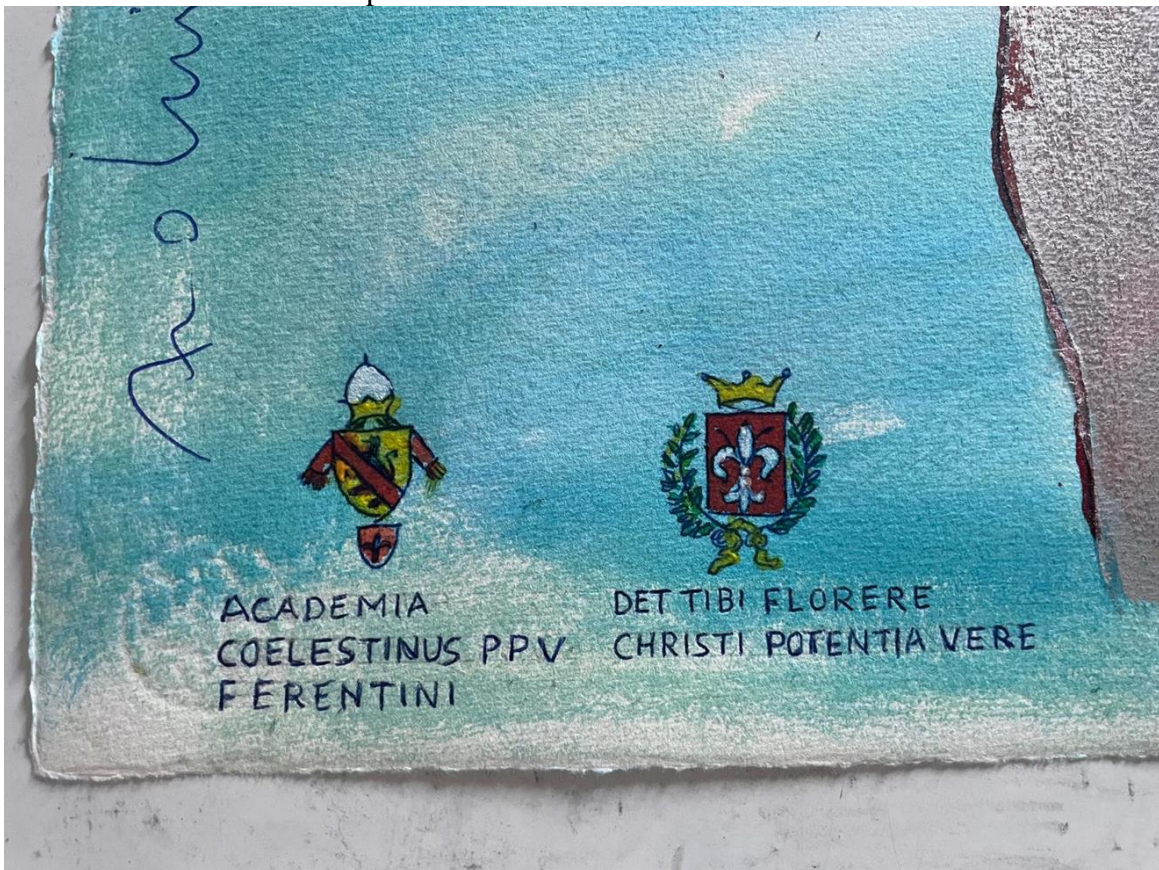
Enzo Arduini, studio per la realizzazione del Palio Celestino V, 2024 particolare dei loghi