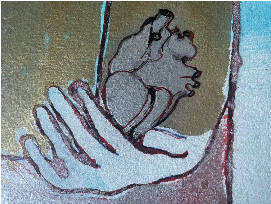
Enzo Arduini, studio per la realizzazione del Palio Celestino V, 2024 particolare della mano e del cuore