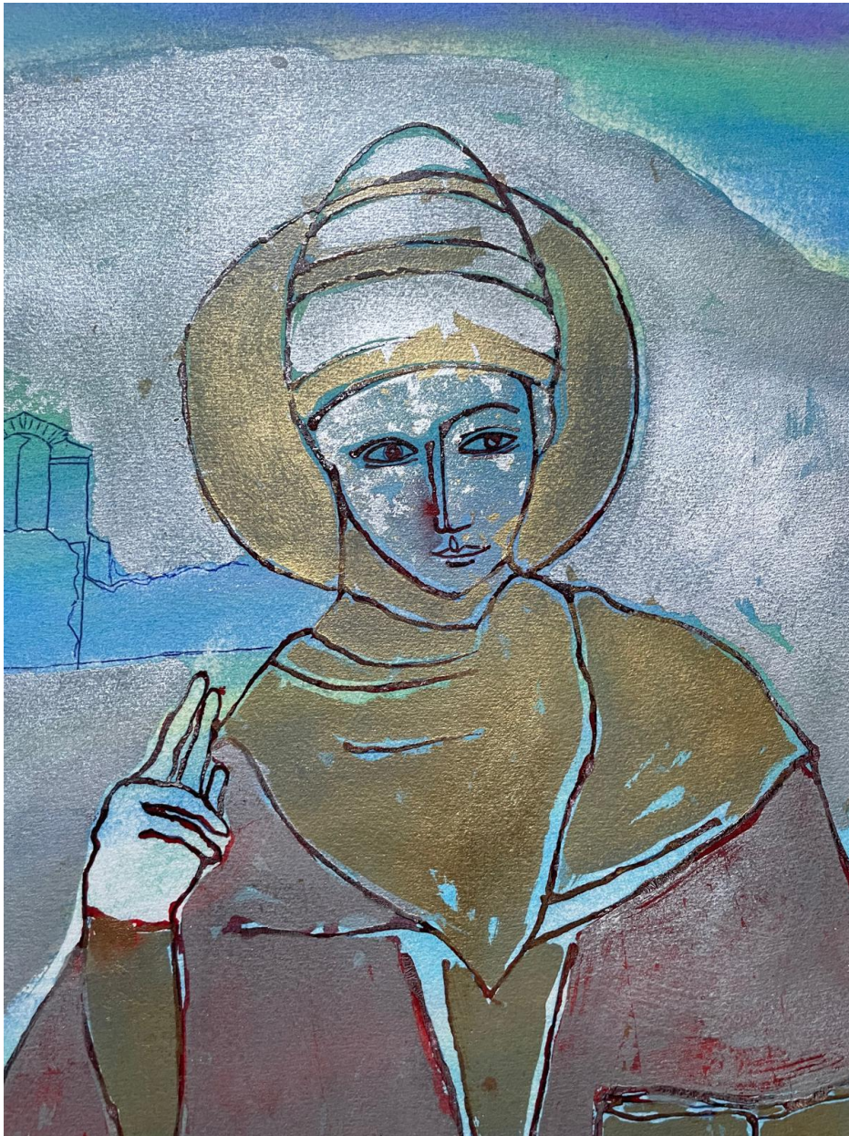
Enzo Arduini, studio per la realizzazione del Palio Celestino V, 2024 particolare