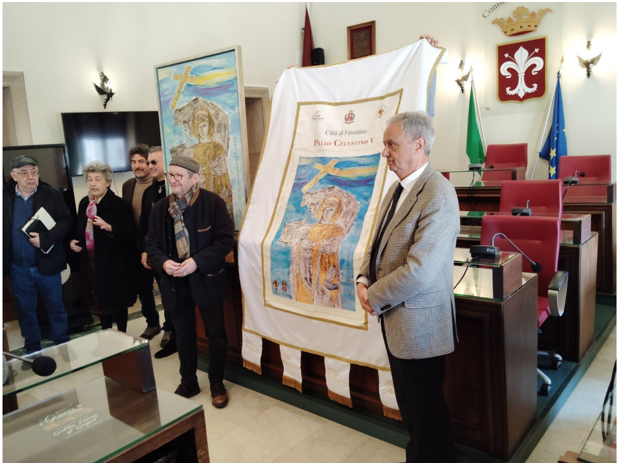
Ferentino, Sala Consiliare Comune di Ferentino 11 aprile 2025 ore 11.00 prima esposizione del Palio Celestino V