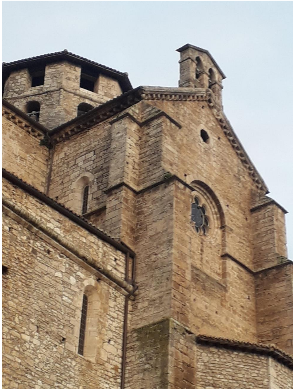
9 giugno 2022

Ferentino Chiesa di S. Maria Maggiore Lato meridionale