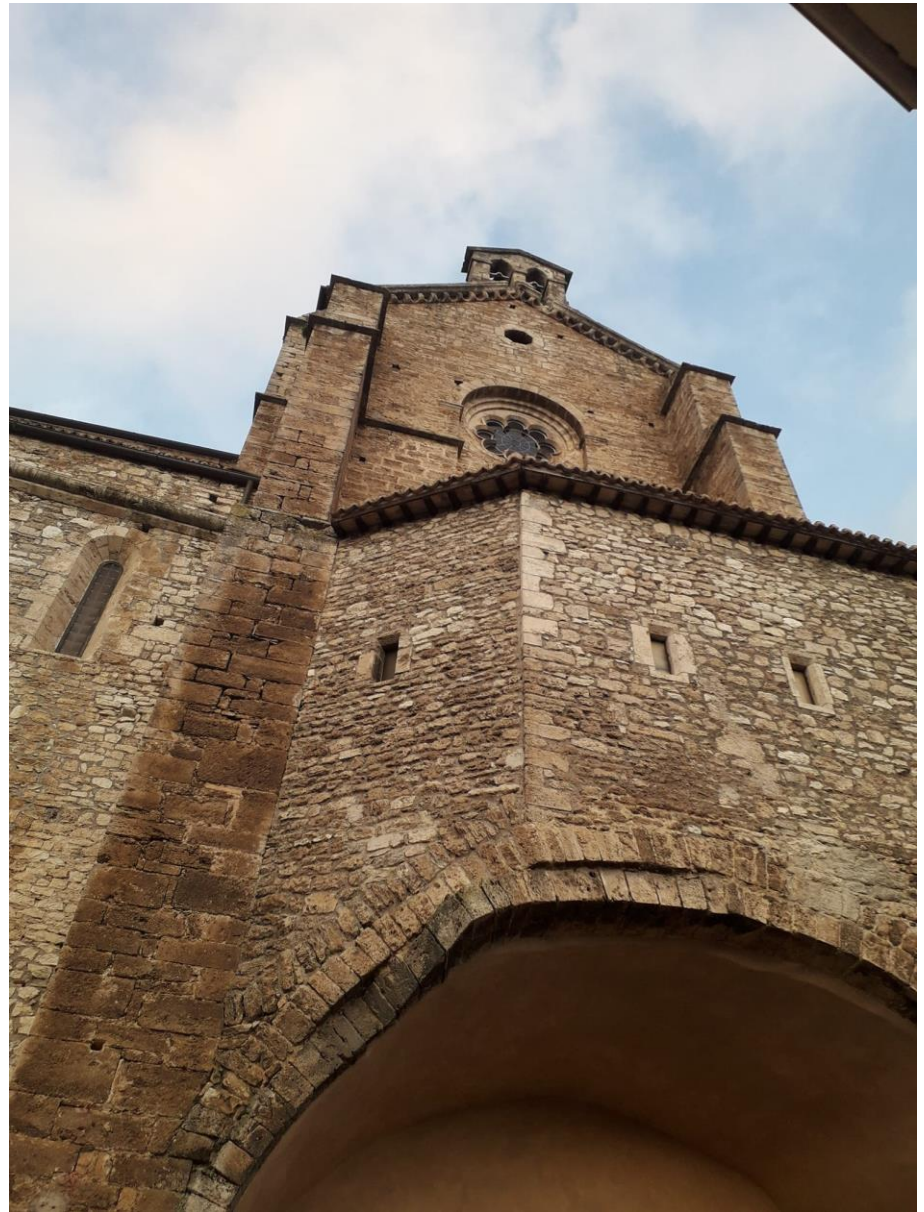
9 giugno 2022

Ferentino Chiesa di S. Maria Maggiore Lato meridionale