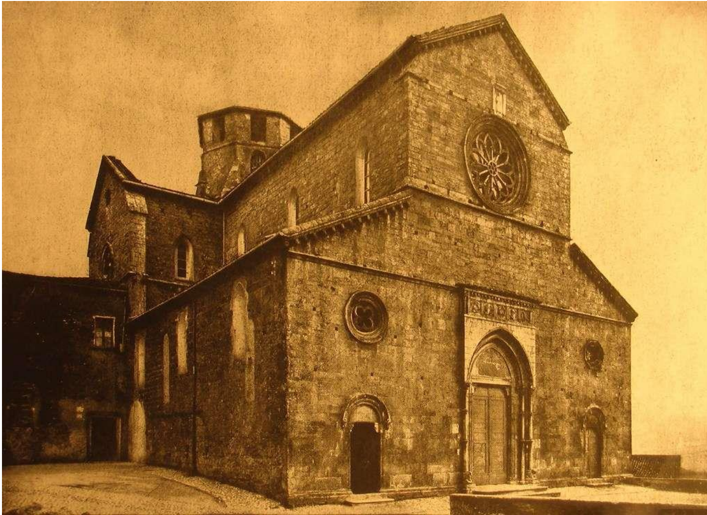
Ferentino, Chiesa di S. Maria Maggiore, facciata