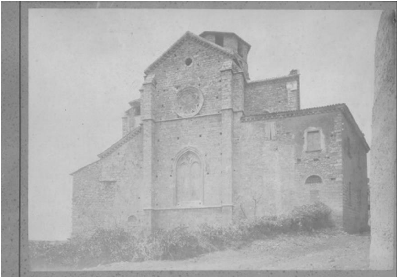
Ferentino, chiesa di S. Maria Maggiore, facciata, fine sec. XIX (prima del restauro) Foto all'albumina