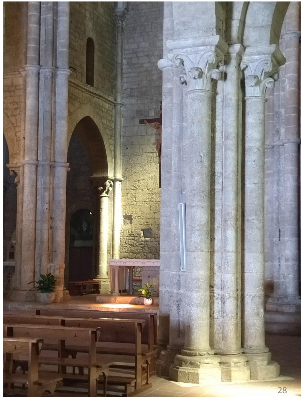
13 agosto 2022, ore 15.30