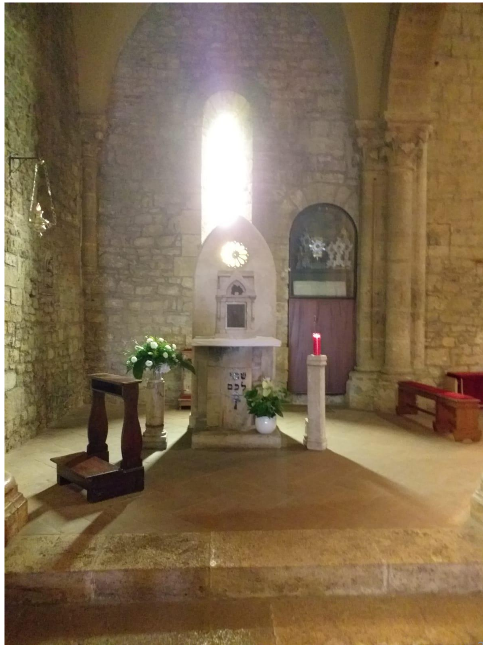
10 giugno 2022

Ferentino Chiesa di S. Maria Maggiore Navata sinistra Cappella del Sacramento