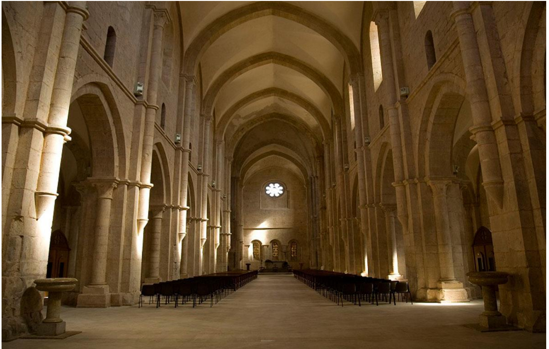
Abbazia di Fossanova, interno