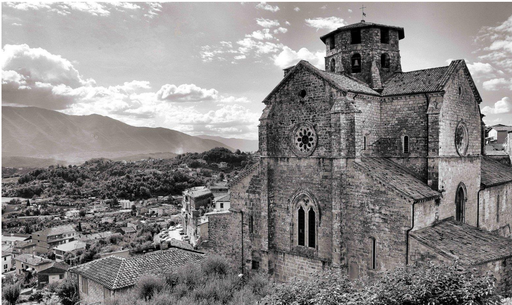
Chiesa di S. Maria Maggiore, facciata orientale