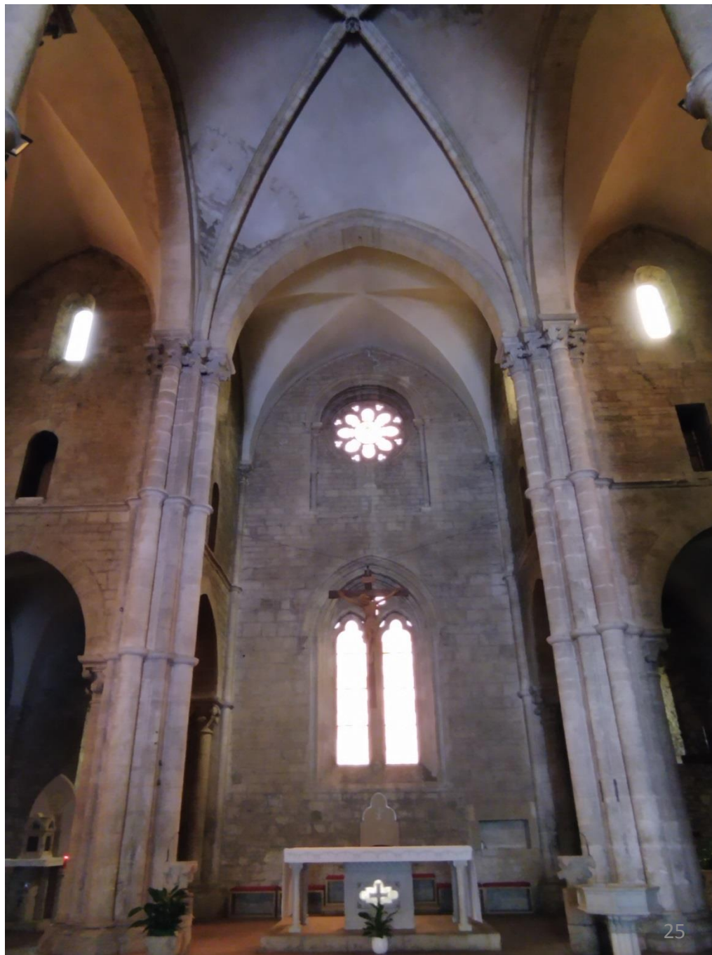
13 agosto 2022, ore 15.30

Ferentino Chiesa di S. Maria Maggiore Interno, presbiterio