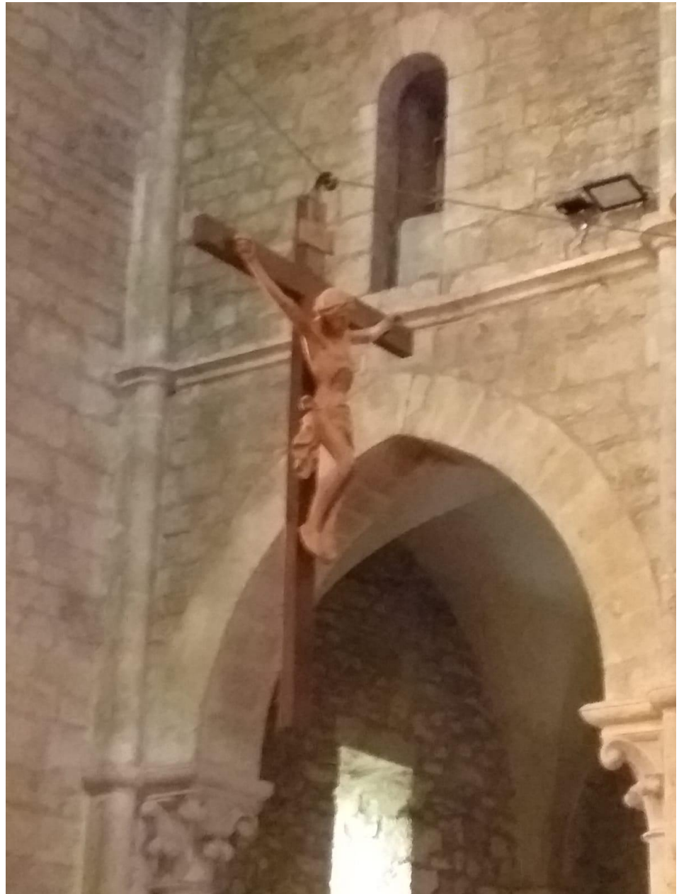
10 giugno 2022