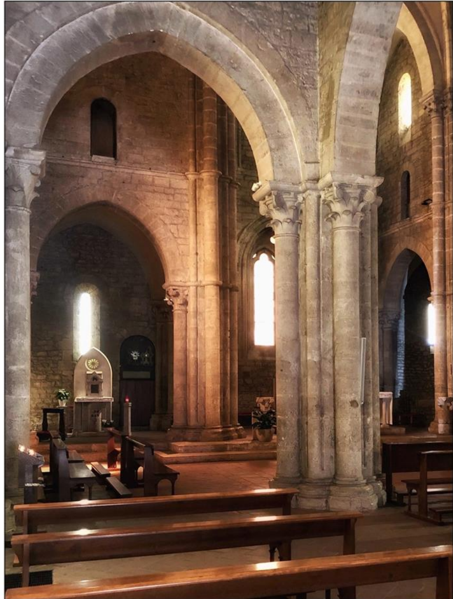
27 Settembre 2022