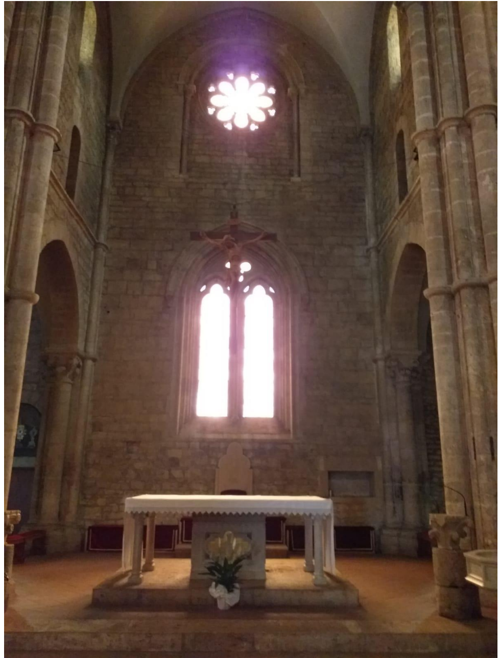
10 giugno 2022