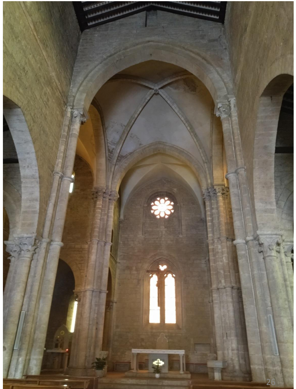
13 agosto 2022, ore 15.30