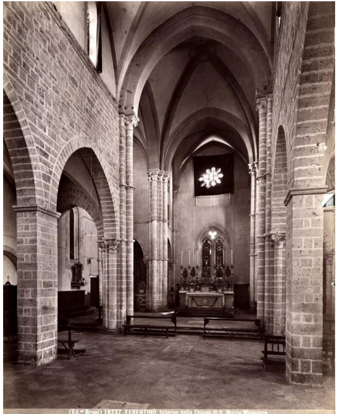
(Ed. Brogi) 18737. FERENTINO. Interno della Chiesa di S. Maria Maggiore.