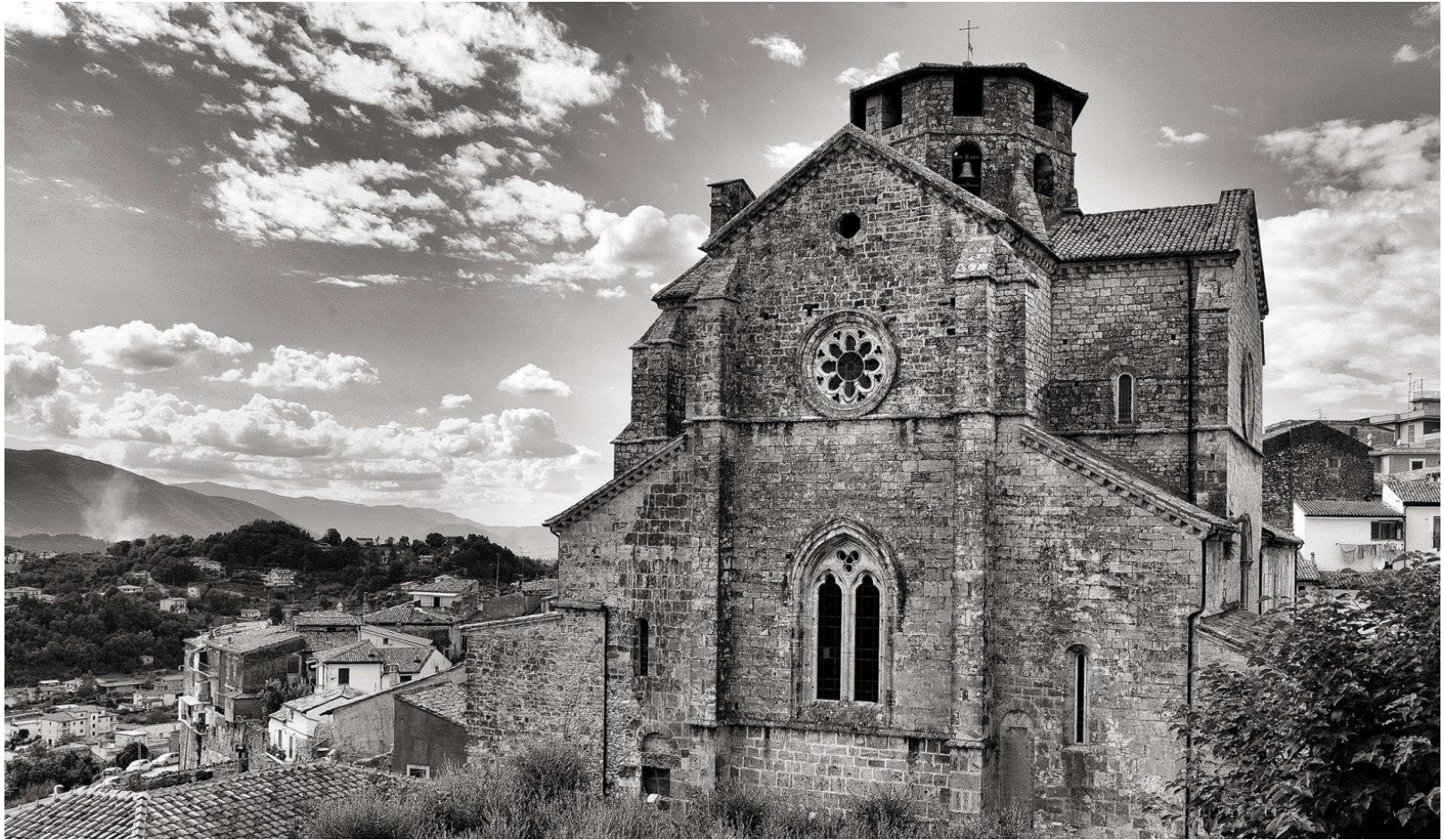
Chiesa di S. Maria Maggiore, facciata orientale