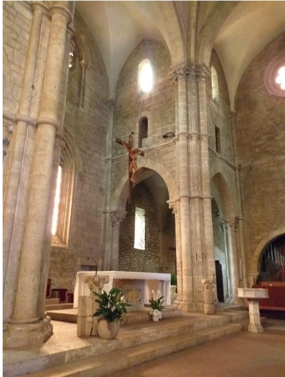
10 giugno 2022