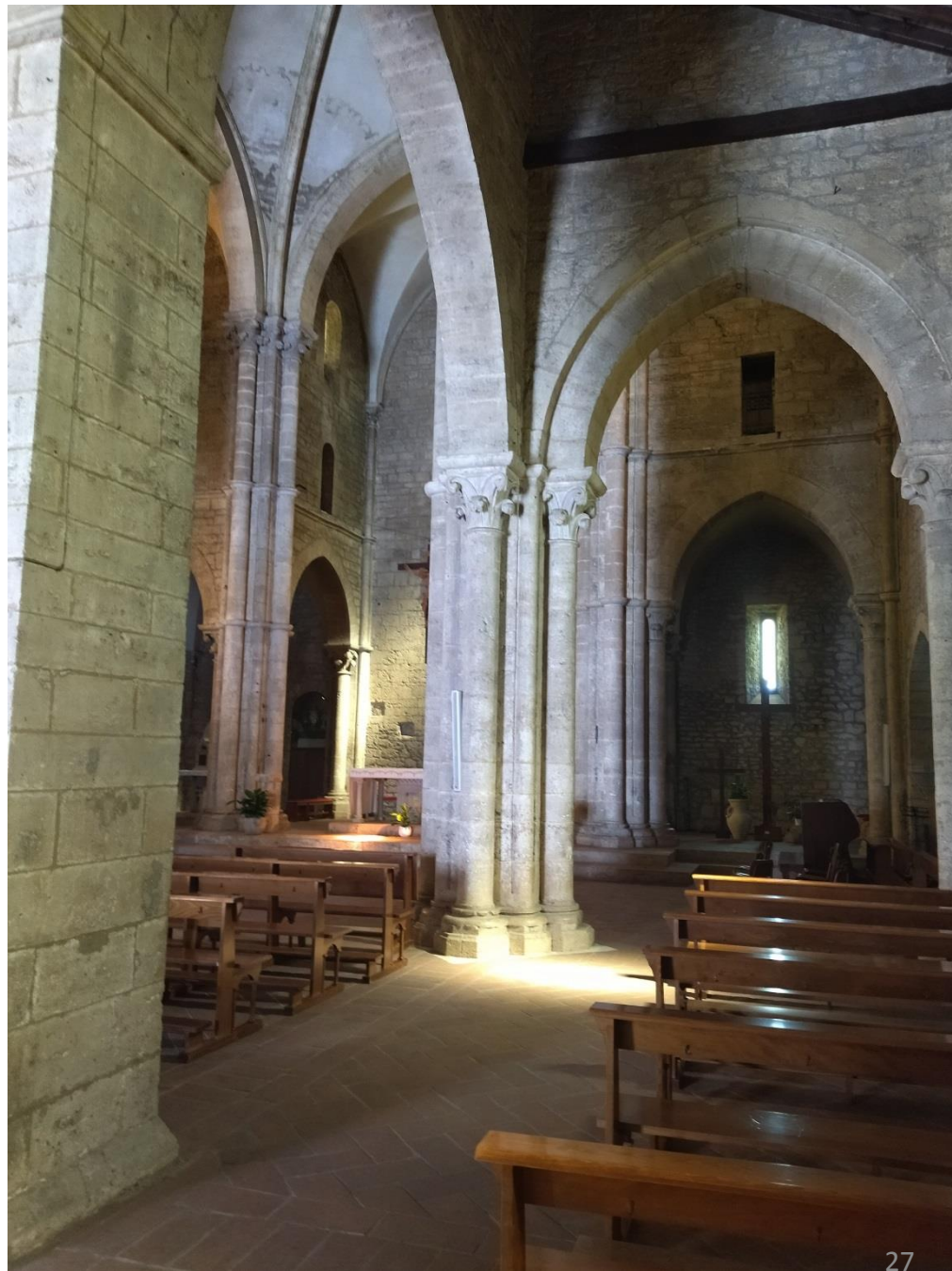
13 agosto 2022, ore 15.30

Ferentino Chiesa di S. Maria Maggiore Interno, navata destra