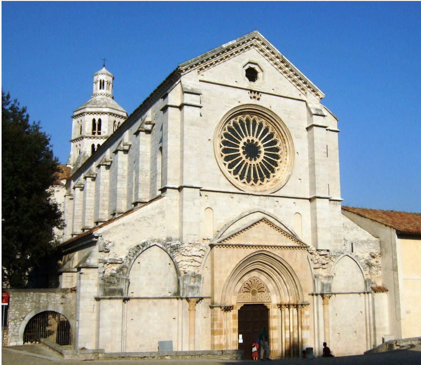
Fossanova, Abbazia, facciata