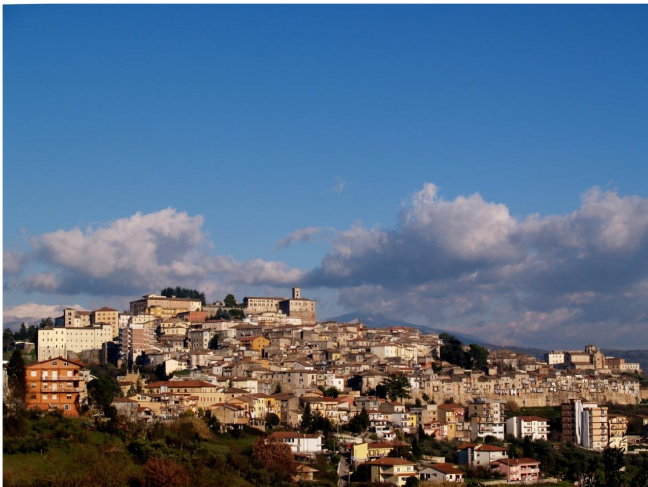
Ferentino, Panorama

Enrico di Svevia, venuto in Italia per prendere possesso del Regno Normanno, avendo sposato l'ultima erede della famiglia Altavilla, Costanza, nel 1186 invase il territorio della Campagna e assediò Ferentino per nove giorni. ( Annales Ceccanenses , p. 296, in MGH, SS, XIX, 1866, p. 287-288) Nel 1197 Enrico imperatore si portò a Ferentino pacificamente e vi dimorò per sette giorni. ( Annales Ceccanenses , p. 294, in MGH, SS, XIX, 1866, p. 287-288)