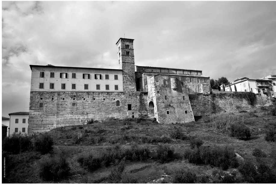
Avancorpo dell'Acropoli (II Sec. a.C. - lato sud/est)