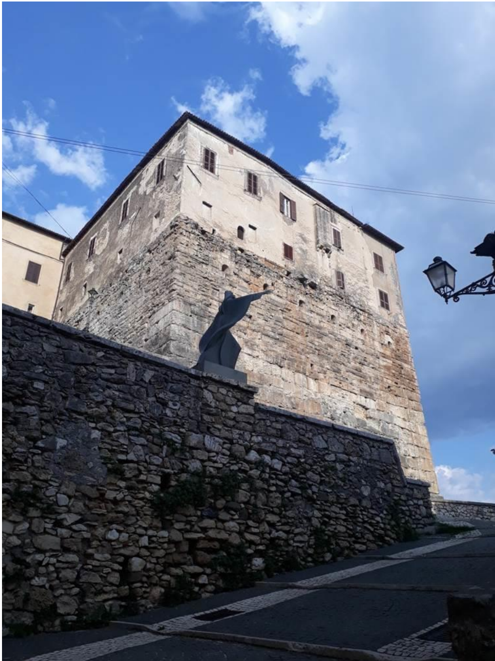
Acropoli romana, avancorpo meridionale, II sec. a. C.

L'avancorpo è costituito da una imponente fascia muraria e la struttura, a pianta quadrangolare, presenta all'interno tre ambienti rettangolari, circondati da quattro corridoi, coperti da volte a botte, senza soluzione di continuità.