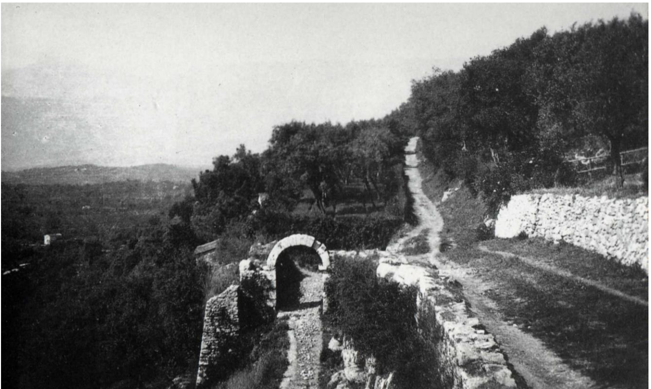
Porta S. Croce in una foto degli anni '50 del secolo scorso

Interessante notare che la porta aveva perso in età imprecisata, forse nell'epoca medievale, il secondo fornice, quello interno. Una fotografia del secolo scorso, scattata prima dei lavori di allargamento della via soprastante, oggi denominata Via Circonvallazione Ten. Alberto Lolli-Ghetti MOVIM, mostra la porta con un solo fornice. La Via Circonvallazione fu costruita sbancando le pendici della collina, che si notano sulla destra della foto e che erano ricoperte totalmente da rigogliose piante di olivo.