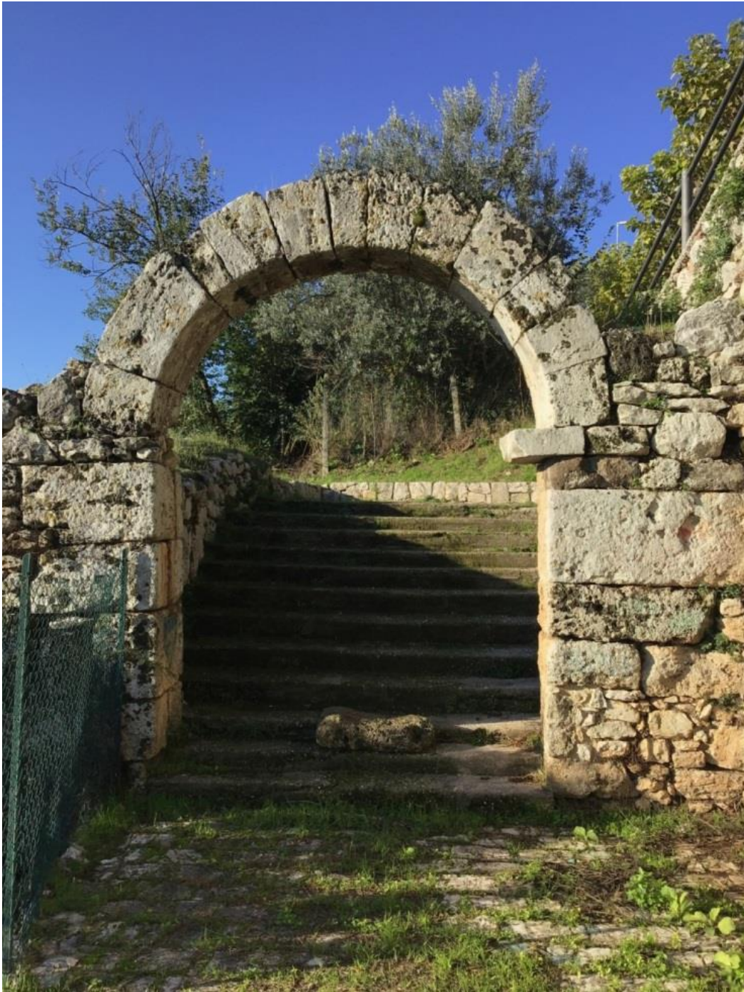
Porta S. Croce

Ad est della Città, nella prima cerchia delle mura, in corrispondenza della porta di sortita dalla cittadella acropolica, detta Grottapara, esistono i ruderi di una porta, gemella a quella di porta Casamari, ma di dimensioni più ridotte: Porta S. Croce, del II secolo a.C.