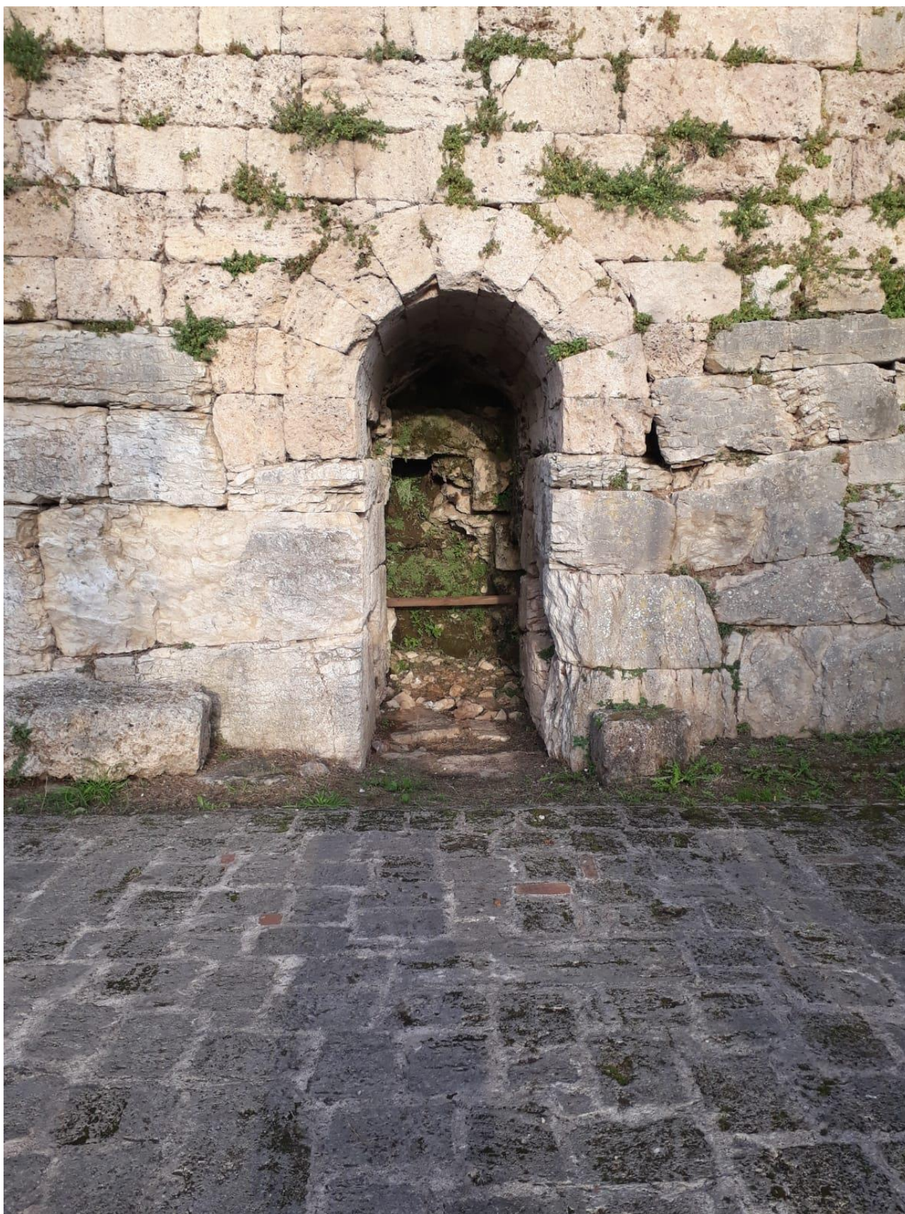
Porta Murata – tratto sottostante il campetto “Martino Filetico”