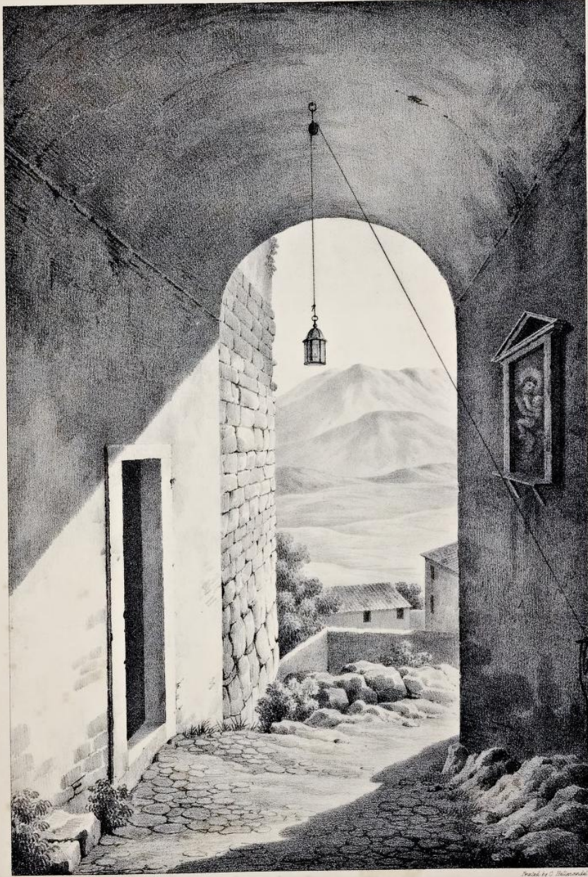
ANOTHER VIEW OF THE WALL.