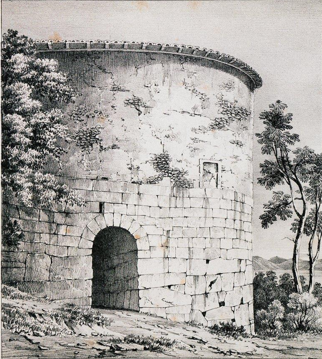
ANOTHER GATE AT FERENTINUM.

by Edward Dodwell (1767-1832), Londra 1834, cit., Porta Stupa, p. 250