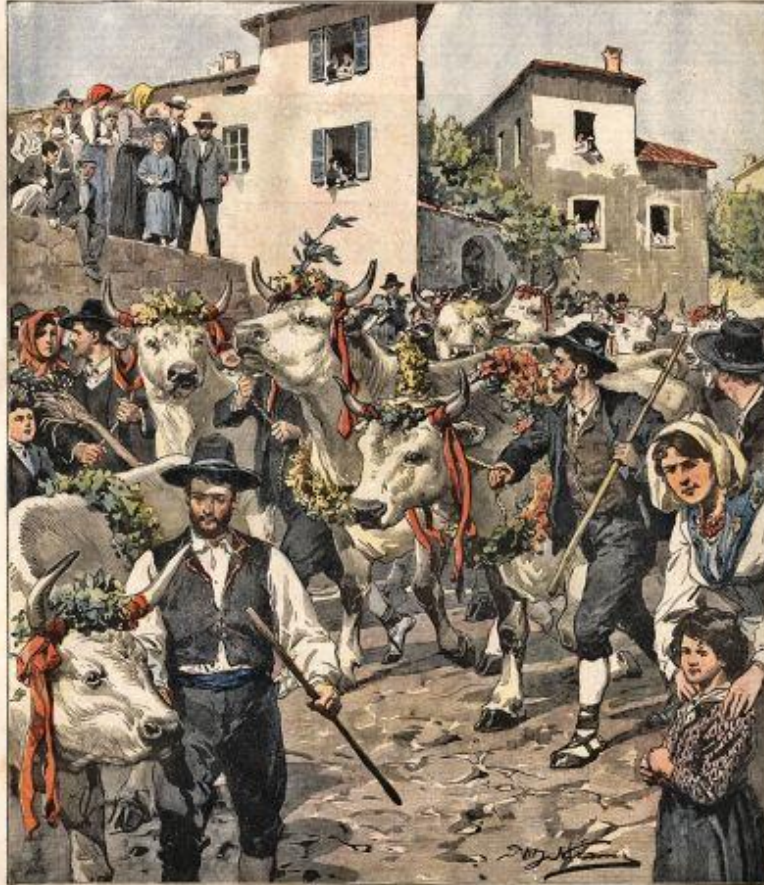
Costumi caratteristici: un corteo di tori rossagnoli a Pontecervo (Caserta).

DEL CORRIERE ANNO 1907 L. 2 - L. 10 - Sondrio - 2,75 - 6,25 Si pubblica a Milano ogni Domenica Dono agli Abbonati del "Corriere della Sera." UFFICI DEL CORRIERE: VIA BOLEGGIO, 119 MILANO ANNO IX. - N. 45. 20-27 Ottobre 1907. Costo ogni numero.