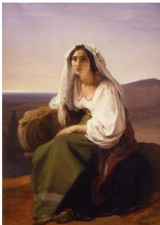
Francesco Hayez, Ciociara

3 GIUGNO 2016 AULA MAGNA DELL'IIS "Martino Filetico" - Ferentino Ore 11.30