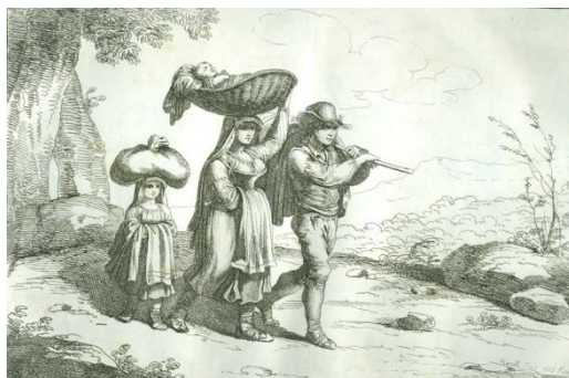
Bartolomeo Pinelli, Famiglia di Ciociari