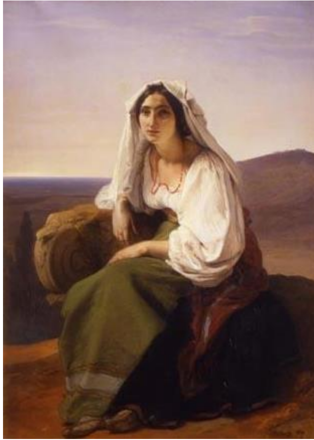
Francesco Hayez, Ciociara